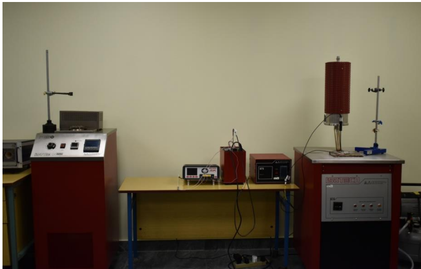
Նկ.2 Հեղուկային յուղային թերմոստատ Isotech 785 (50 °C : + 250 °C և բարձր ջերմաստիճանային կալիբրատոր Isotech 875 (50 °C : + 660 °C)